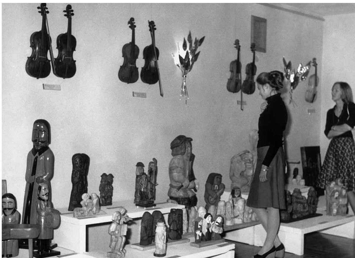
Z okazji Konkursu, Towarzystwo Muzyczne im. H. Wieniawskiego i Muzeum Narodowe w Poznaniu, zorganizowały ogólnopolski konkurs na ludowe instrumenty muzyczne i rzeźbę ludową o tematyce muzycznej. Na zdjęciu: fragment wystawy pokonkursowej