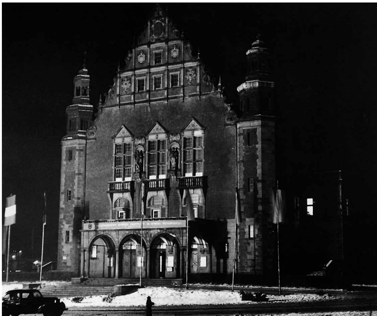
Aula Uniwersytetu Poznańskiego — jedna z najpiękniejszych i słynna z walorów akustycznych, sala koncertowa w Europie — stała się odtąd miejscem Międzynarodowych Konkursów Skrzypcowych im. H. Wieniawskiego