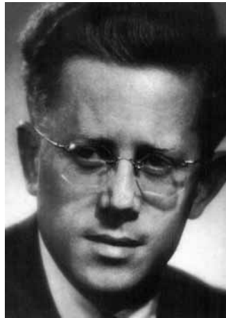
Orkiestrą filharmoniczną dyrygowali: Jan Krenz (na zdjęciu z lewej) i Stanisław Wisłocki (z prawej)