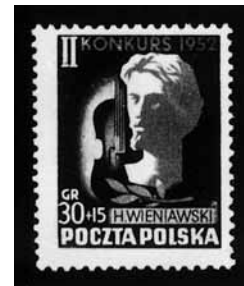
Poczta Polska z okazji Konkursu wydała okolicznościowe znaczki