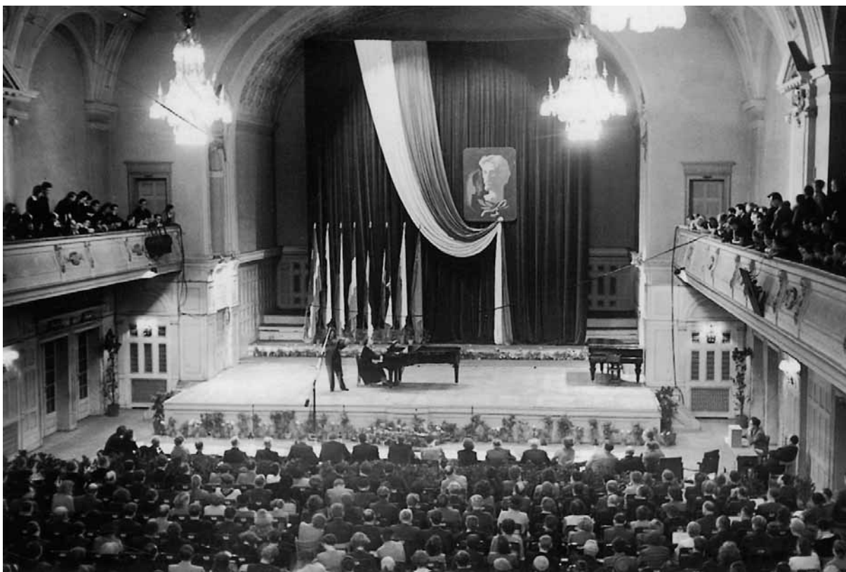
Estrada konkursowa podczas przesłuchań I etapu