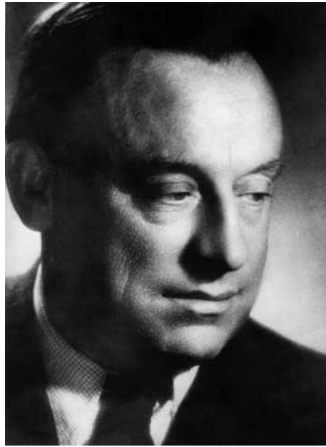
Tadeusz Szeligowski (1896-1963), kompozytor i pedagog, profesor Państwowej Wyższej Szkoły Muzycznej w Poznaniu, przewodniczący jury