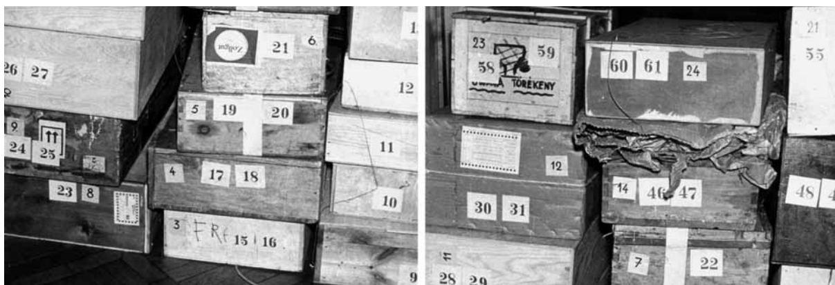
Na zdjęciu — kolejna partia konkursowych skrzypiec, jeszcze nie rozpakowanych