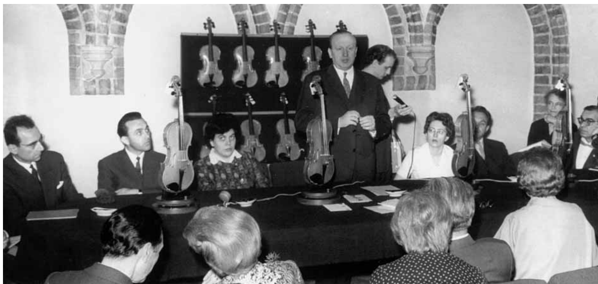
Końcowe posiedzenie jury i ogłoszenie wyników Konkursu