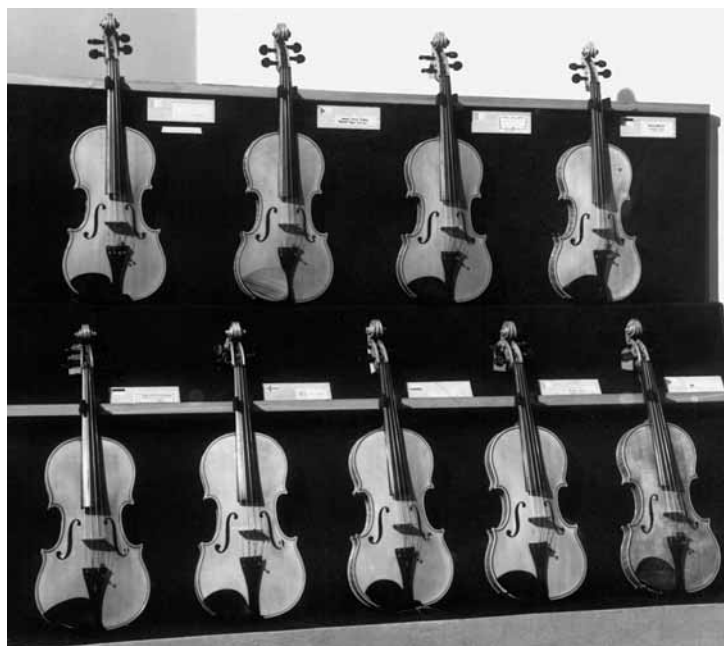
Pokonkursowa wystawa instrumentów